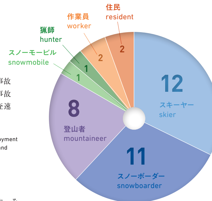
活動別の雪崩死者（人） Avalanche Fatalities by Activity (2021-2025)